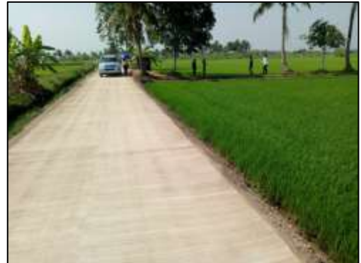
๑๑. โครงการก่อสร้างถนนคสล. สายคู ๔ (๒๐L-๑R) หมู่ที่ ๒ สายข้างนางสม บุญทิม