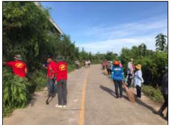
๒๔. โครงการกำจัดวัชพืช และปรับปรุงภูมิทัศน์ภายในตำบล