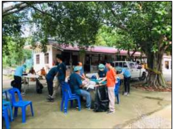
๑๙. โครงการณรงค์เฝ้าระวัง ควบคุม ป้องกัน และระงับการแพร่ระบาดของโรคไข้เลือดออก