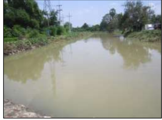
๒๖. โครงการเฉลิมพระเกียรติพระบาท สมเด็จพระเจ้าอยู่หัว และสมเด็จพระนางเจ้าฯ พระบรมราชินี เนื่องในโอกาสมหามงคลพระราชพิธีบรมราชาภิเษก พุทธศักราช ๒๕๖๒ องค์การบริหารส่วนตำบลห้วยโรง อำเภอเขาย้อย จังหวัดเพชรบุรี