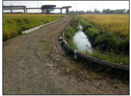
๖. โครงการก่อสร้างถนน คสล. สายคู ๒.๓ (๒๐L-๑R) หมู่ที่ ๓ สายข้างนางทุเรียน จันทร์ปรุง ช่วงที่ ๓