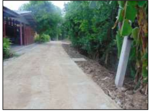
๑๔. โครงการลานคอนกรีตเสริมเหล็กถนนกประสงค์ พื้นที่ ที่ ๑ หมู่ที่ ๑ บริเวณหน้าศูนย์วิปัสสนากรรมฐาน