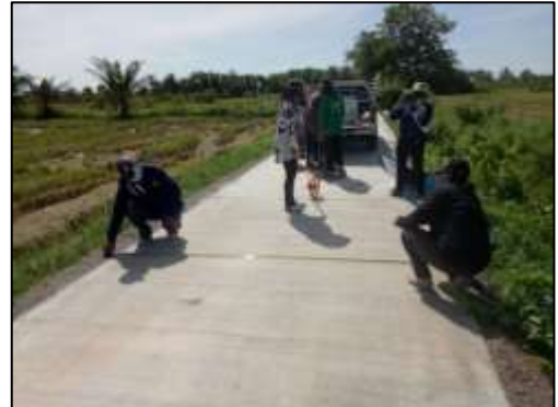
๑๒. โครงการก่อสร้างถนนคสล. สายคู ๔.๓ (๒๐L-๑R) หมู่ที่ ๒ สายนางพะเยาว์ สิงห์โต