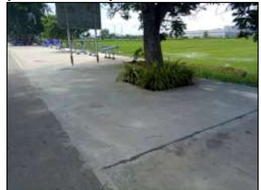
๑๕. โครงการลานคอนกรีตเสริมเหล็กถนนกประสงค์ พื้นที่ ที่ ๒ หมู่ที่ ๑ บริเวณข้างป้อมตำรวจ